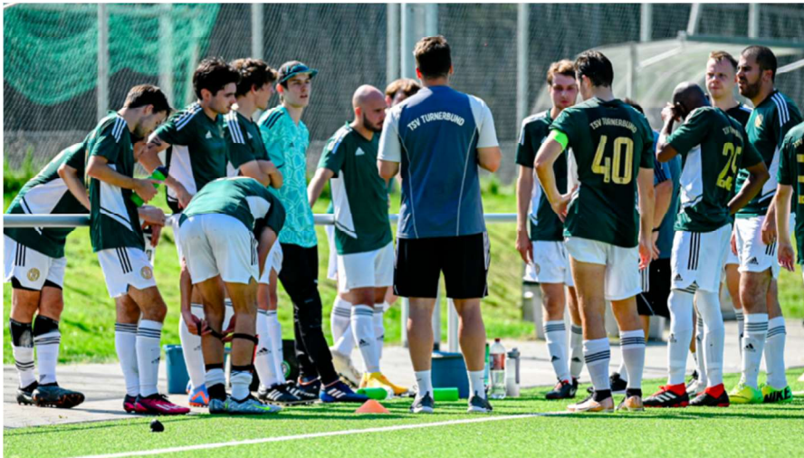
Foto: Zweite beim Sieg gegen Solln III

Das gilt auch für die erste Herrenmannschaft. Das Team verschläft mit einer Art "Turnerbundkrankheit" die ersten Saisonspiele, um dann aufzuwachen. Nach der ersten Niederlagenserie gewinnen sie fünf Spiele am Stück und müssen sich dem Ligaprimus FC Alte Haide im Spitzenspiel knapp mit 2:3 geschlagen geben.