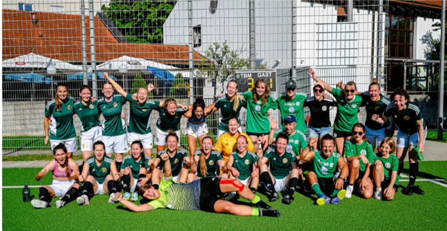
Foto: Damen nach dem Pokal-Sieg gegen Stern

Nach den anfänglichen Startschwierigkeiten hat sich die zweite Herrenmannschaft gefangen. In der B-Klasse ist man mit einigen starken Spielen im oberen Tabellendrittel gelandet. Der Zusammenhalt von erster und zweiter Mannschaft sowie dem Trainerteam trägt erste Früchte. Hier gilt es weiter dranbleiben und nicht nach zu lassen. Mit weiteren erfolgreichen Spielen kann die Zweite auf einem respektablen Tabellenplatz in die lange Winterpause gehen.